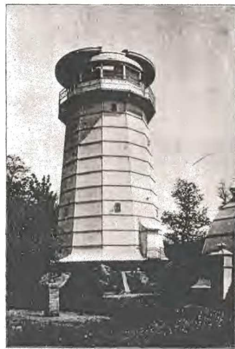
Station Potsdam Helmert-Turm Zentralpunkt der Deutschen Triangulation