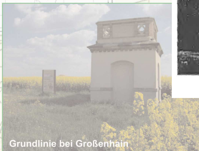
Grundlinie bei Großenhain